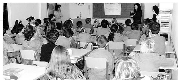
Bambini a lezione. È bufera sulla riforma scolastica